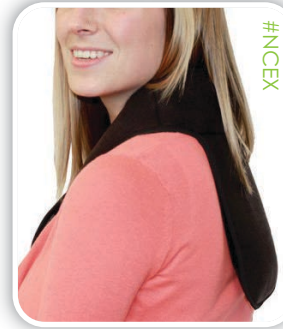
Cuello y columna