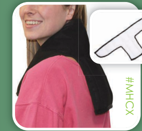
Cuello y columna