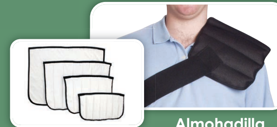
Almohadilla localizada, estándar, King y XL