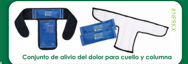
Conjunto de alivio del dolor para cuello y columna

¡Ahorre un 15% comprando un conjunto terapéutico!